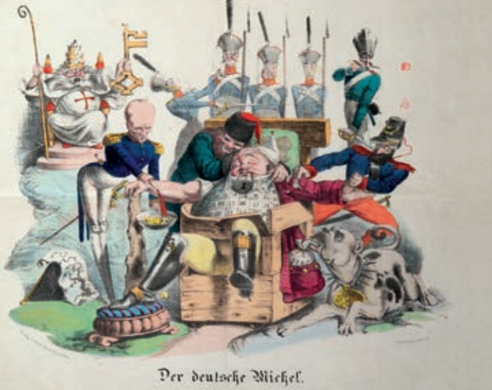
Der deutsche Michel.