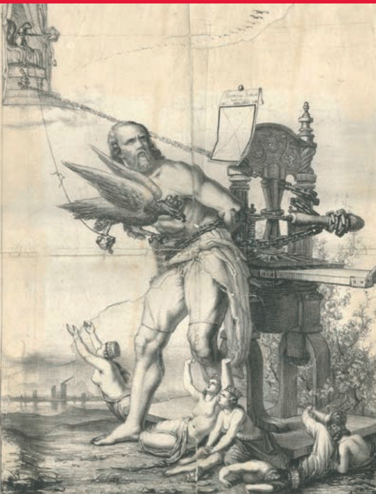
Karl Marx als gefesselter Prometheus, 1843

„Wir mussten eben nach Köln gehen und nicht nach Berlin. Erstens war Köln das Zentrum der Rheinprovinz, die die französische Revolution durchgemacht, sich im Code Napoléon moderne Rechtsanschauungen bewahrt, die weitaus bedeutendste große Industrie entwickelt hatte und in jeder Beziehung damals der fortgeschrittenste Teil Deutschlands war. Das damalige Berlin kannten wir nur zu gut aus eigener Anschauung, mit seiner kaum entstehenden Bourgeoisie, seinem maulfrechen, aber tatfeigen, kriechenden Kleinbürgertum, seinen noch total unentwickelten Arbeitern, seinen massenhaften Bürokraten, Adels- und Hofgesindel, seinem ganzen Charakter als bloße ‚Residenz‘.“